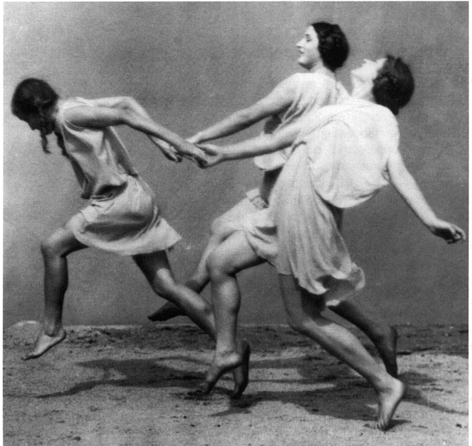
Institut Jacques Dalcroze, 1915.

Les Nations Unies étant chargées de promouvoir l'égalité et dépositaires de la Convention sur l'élimination des discriminations à l'égard des femmes, on est en droit d'attendre que leur Secrétariat donne l'exemple... Depuis quelques années, fruit des efforts des secrétaires généraux et d'exhortations entendues par certains gouvernements, des femmes qui n'ont rien d'alibis ont certes pris la tête d'institutions du système: Mary Robinson, Haut Commissaire aux droits de l'homme, Louise Fréchette, Vice-secrétaire générale des Nations Unies à New York, Sadako Ogata, Haut Commissaire aux réfugiés, Carol Bellamy à l'Unicef, Catherine Bertini au Programme alimentaire mondial, le Dr Gro Harlem Brundtland à l'OMS, Louise Arbour au poste de Procureur des Tribunaux pénaux internationaux pour l'ex-Yougoslavie et le Rwanda, pour ne citer que les principales. On remarquera cependant que leur percée se manifeste surtout au niveau des questions sociales et humanitaires, beaucoup plus timidement dans ces bastions traditionnellement masculins que sont l'économie et les affaires politiques, le désarmement, les télécommunications, la propriété intellectuelle ou même l'UNESCO, et l'on peut encore rêver à la nomination d'une Secrétaire générale des Nations Unies... Aux échelons moins prestigieux où gravitent la majorité des fonctionnaires, les groupes pour l'égalité des droits des femmes aux Nations Unies, créés à New York, à Vienne, à