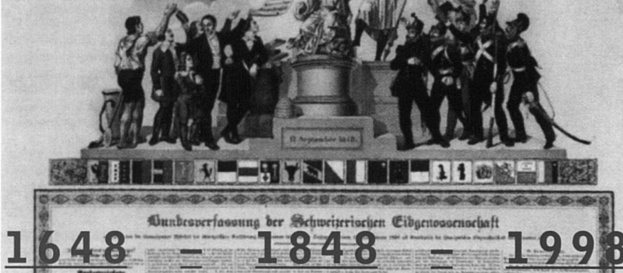
Image tirée de: Erinnerung an den Westfälischen Frieden . Peter F. Kopp, 1998.

«Marabout'd'ficelle» poursuit sa série «Idée suisse» avec des portraits de personnages importants durant la période de 1848 à 1914. Du lundi au jeudi à 15h30. Sur RSR, la Première