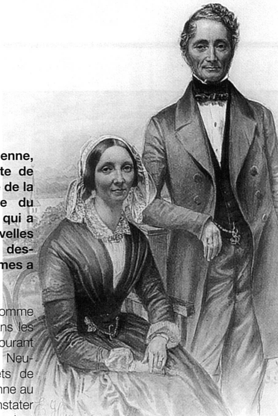
Représentation symbolique du couple bourgeois du XIXe siècle. Le mari domine la femme.

L'exposition biennoise met aussi en évidence le nouveau mode de vie des bourgeois, en soulignant le passage de la «grande maison» au nid familial, séparant clairement habitat et travail, vie publique et privée. La famille en