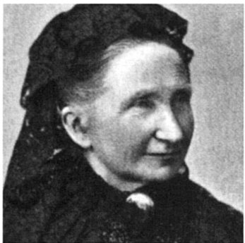
Marie Goegg-Pouchoulin (1826-1899)

Des fédéralistes ont crié à l'atteinte à la souveraineté cantonale. Des juristes ont crié qu'on avait court-circuité la procédure normale qui aurait consisté à modifier d'abord la Constitution. Mais on peut faire confiance aux sept juges d'avoir bien réfléchi avant.