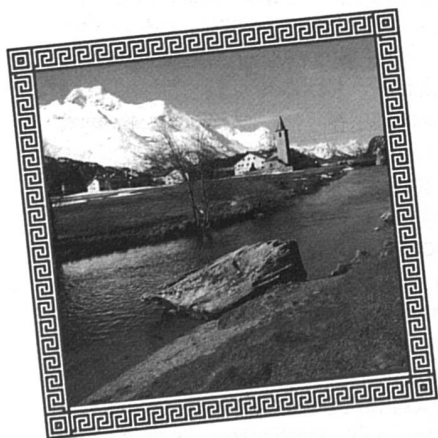
Tiré de La Mémoire de l'humanité Les grands événements de l'histoire des femmes. Larousse 1993.

Le droit des femmes: Revue de la femme et de la jeune fille. Une petite revue, mais qui, dans l'expression des idées, est tout à fait remarquable. Trois femmes célèbres devaient illustrer le premier numéro: Catherine II de Russie, la Parisienne Manon Rolland et Germaine de Staël. Les illustrations ne sont pas prêtes, l'imprimeur ne peut retarder la parution, on annonce qu'elles paraîtront dans le prochain numéro, lequel ne paraît pas, et donc nous ne les verrons pas. Il annonce que la préférence sera donnée aux plumes féminines. Son prix est exorbitant: 12 francs suisses par année, soit le loyer d'un mois pour un appartement de trois pièces. Il s'adressait donc à la bourgeoisie, non aux paysannes.