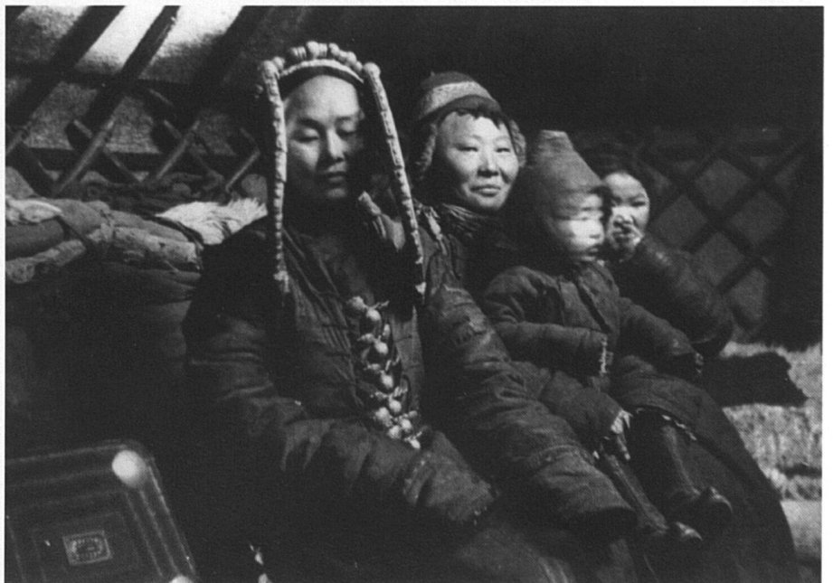
Princesse khalka, Barga, Mandchoukouo japonais (aujourd'hui Mandchourie, Chine), 1934