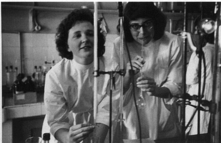
Labo de Chimie, dosage des chlorures, mai 1958

les filières scientifiques, pourquoi elles rechignent à passer des doctorats, pourquoi elles sont aux abonnées presque absentes des postes importants, pourquoi on veut donner l'impression que les femmes découvrent le monde du travail, alors qu'une bonne partie d'entre elles a toujours été sur le marché de l'emploi – mal rétribué, pourquoi les journaux relatent de manière absolument récurrente les mêmes préoccupations, dont voici quelques exemples: