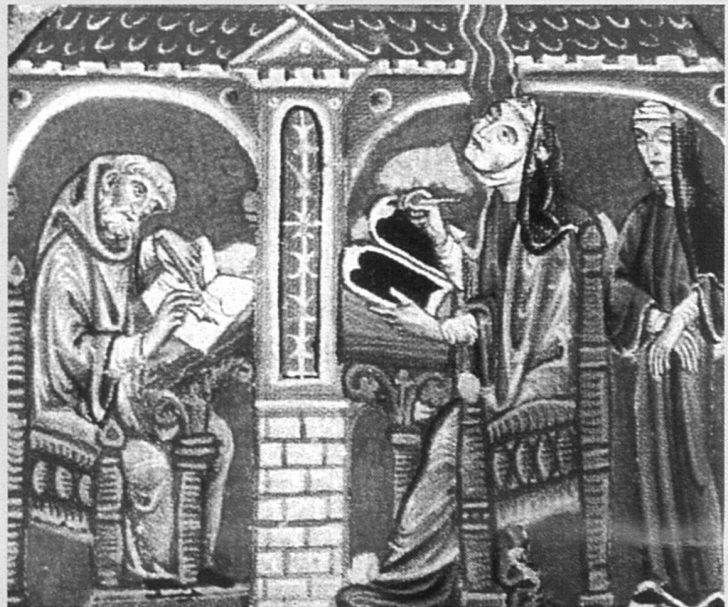
Hildegarde de Bingen recevant la lumière divine

Les CD Ordo Virtutum et récemment Les chants de l'extase* ont rendu Hildegarde de Bingen célèbre dans les pays francophones. Elle l'était déjà en Allemagne et en Suisse allemande. En outre, la médiéviste Régine Pernoud vient d'en donner une biographie**, qu'elle sous-titre Une conscience inspirée du XII e siècle .