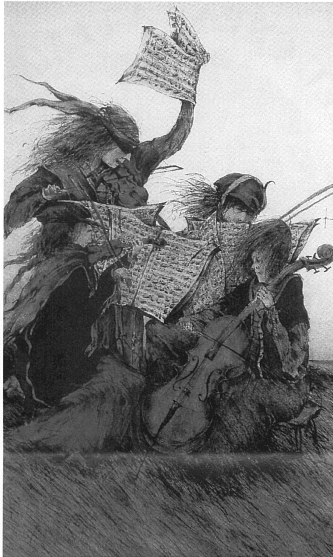
On n'a jamais vu de Beethoven femme! Vraiment?

Version n° 3: enfin, l'homme se raconta des histoires. Nancy Huston fait un petit catalogue des histoires qu'il se raconte, «par exemple, que l'homme ne sort pas de la femme, mais la femme de l'homme. Et Dieu créa la femme. Et de la tête de Zeus jaillit Athéna, armée de pied en cap. Et Héphaïstos fabriqua Pandore. Et Pygmalion donna la vie à Galatée. Et de la côte d'Adam fut tirée Eve» 2 .