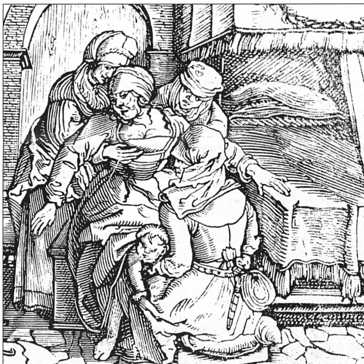
L'accouchement, durant longtemps domaine exclusif des femmes (gravure sur bois, 16 e siècle).

On meurt beaucoup en couches, à cette époque, et dans des souffrances effroyables. Pourtant, dans sa tentative de mettre au pas les accoucheuses, l'Eglise n'est pas mue par des préoccupations d'ordre sanitaire ou humanitaire. Elle a même tendance à considérer comme hérésiarques les pratiques visant à soulager les femmes de douleurs voulues par Dieu. Tu