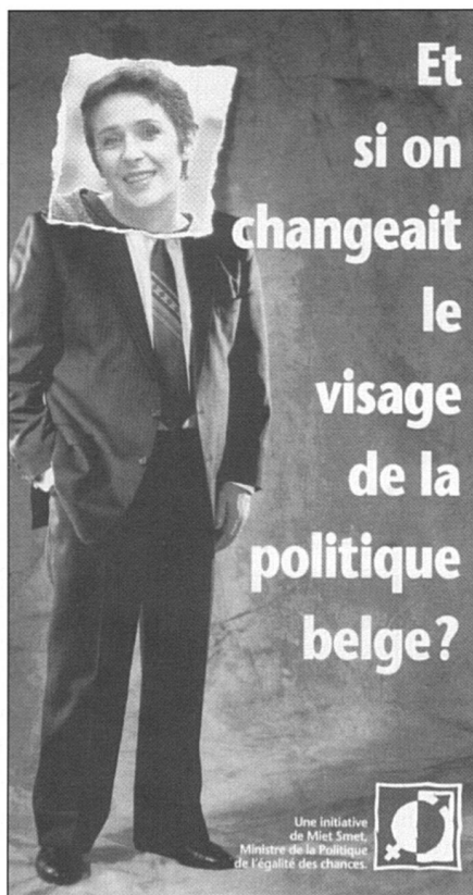
Affiche de la campagne en Belgique.