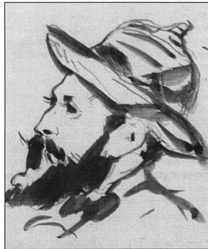
Edouard Manet, Portrait de Claude Monet (1874).