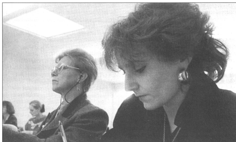
Se former pour réussir.

Autre constat, la mentalité est différente. Dans les années quatre-vingts, la plupart des inscrites au cours proposé par l'Université populaire jurassienne n'avaient guère d'idées sur les démarches à entreprendre pour réussir une réinsertion professionnelle. Elles étaient sorties du circuit économique depuis belle lurette. Aujourd'hui, «les participantes ont gardé un lien avec le monde du travail. Elles en ont suivi l'évolution. Elles éprouvent certes quelques difficultés dans le domaine pratique. Il faut relever toutefois que le cours met surtout l'accent sur une re-