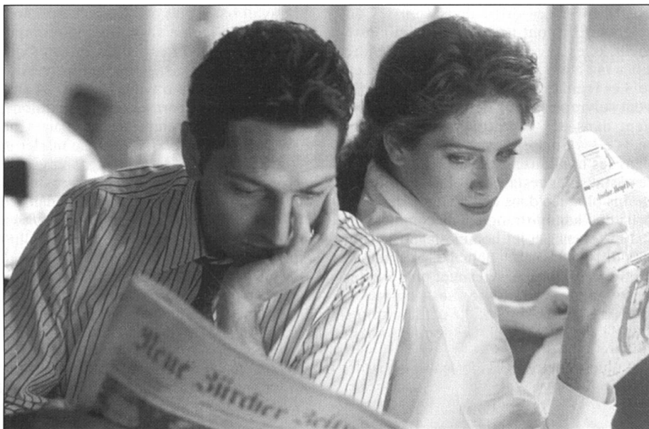
De plus en plus, le couple fait face ensemble à la crise. On discute de l'avenir, on élabore des stratégies.

Quelles sont les répercussions de la crise sur la vie des femmes? Au fil des interviews avec celles qui travaillent dans divers secteurs sociaux se dessine en filigrane