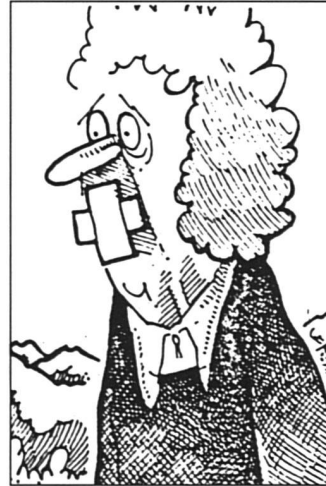
Un dessin réalisé par Barrigue en 1982, qui n'a hélas rien perdu de son actualité...

Suisse d'origine, elle n'est d'Appenzell que par son mariage. On fait courir sur elle des rumeurs songères, et le jour où elle a déposé son recours, on a lancé une pierre dans la vitrine de son magasin de céramiques.