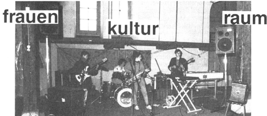
Les femmes du Wyberrat réclament un véritable centre culturel pour les femmes.