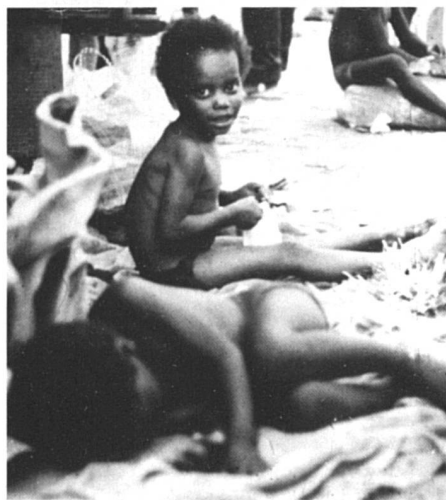
La rue, bouillon de culture de la prostitution.

ils-elles perdent leur identité, n'ont plus d'existence légale, vivent clandestinement jusqu'à 15/16 ans avant de réapparaître dans les bordels. On enlève les enfants dans les rues mais aussi dans les familles pauvres, mais le plus fréquent c'est le placement de fillettes à partir de 5 ans comme employées de maison. Elles sont contraintes à avoir des relations sexuelles avec leur maître, son fils, ses amis. Vers 12/13 ans elles sont mises à la porte et n'ont d'autre solution que la prostitution. On nous a affirmé qu'il est fréquent que les parents des classes aisées recrutent des fillettes indigentes pour l'initiation sexuelle de leurs