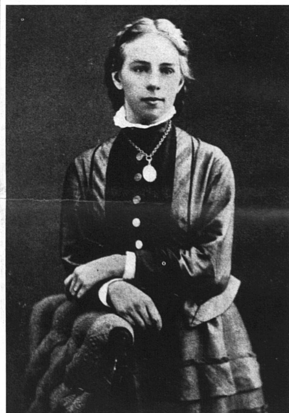
Emilie Kempin-Spyri (1853-1901).

Zurich a été, après Paris, la première Université en Europe à ouvrir officiellement ses cours aux femmes. C'était il y a 120 ans. Un anniversaire que l'association Femmes féminisme recherche et la commission féminine de l'Union suisse des étudiant-e-s de Zurich ont tenu à célébrer. Non seulement pour rendre hommage aux pionnières qui se sont risquées dans ces bastions masculins, mais aussi pour attirer à cette occasion l'attention sur la situation encore précaire des femmes qui étudient ou qui veulent faire carrière dans les hautes écoles (voir article en page 5). C'est une Russe, Nadezda Suslova (1843-1918) qui avait ouvert la