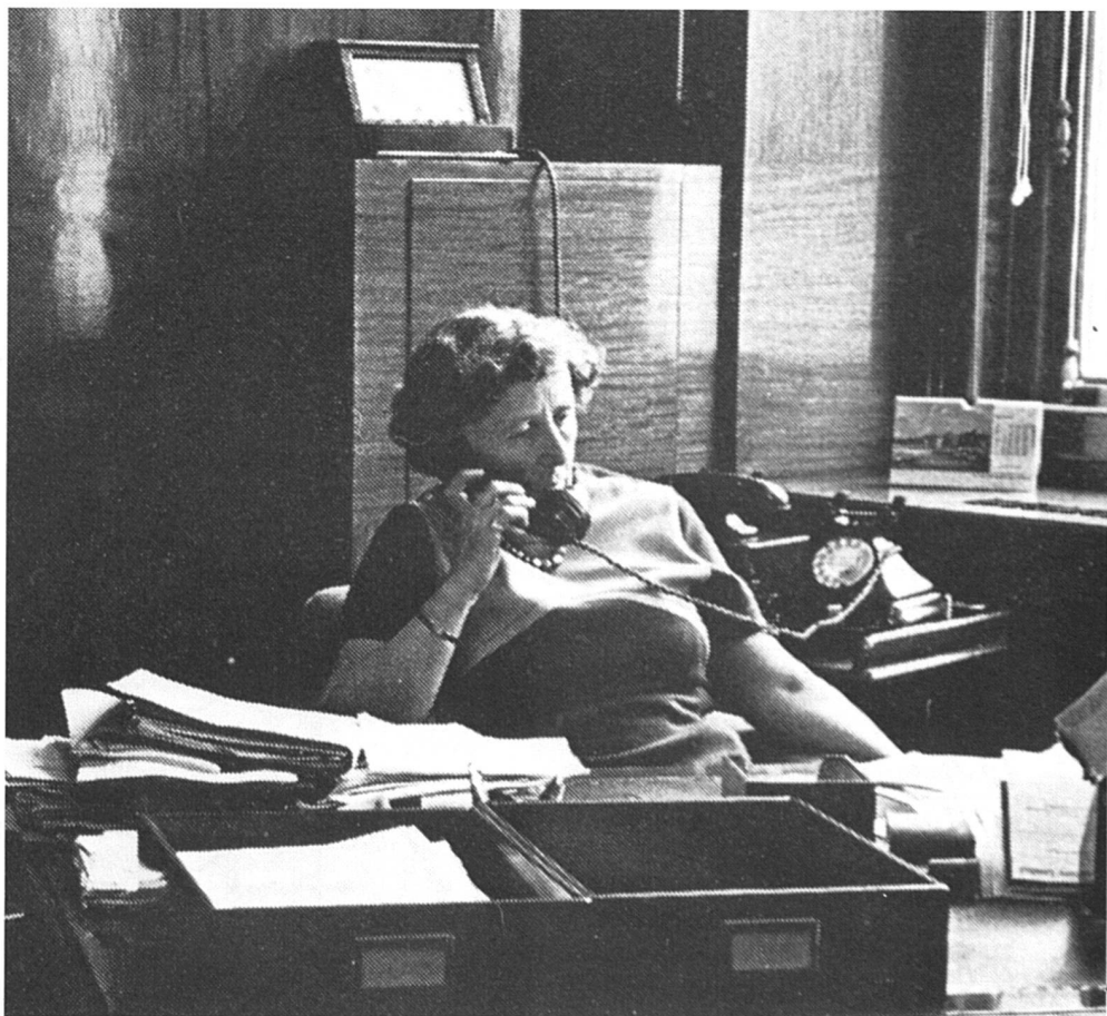
Devenir femme cadre : vouloir est-ce pouvoir ? (Photo tirée de Frauen der Welt , Publication de la NZZ).

de « conseils » qui en dit long sur la discrimination dont elles sont victimes :