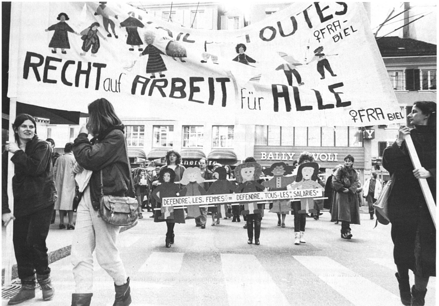
Droit au travail pour toutes... mais quel travail ?