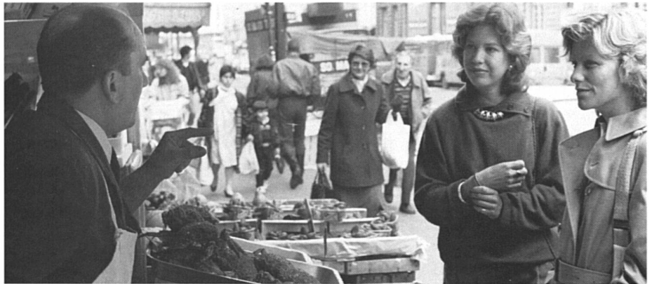
Nourrir sainement la famille (gare aux nitrates dans les salades !) : encore une tâche pour les femmes.

Une meilleure connaissance des fonctions reproductrices de la femme, la découverte de la pilule contraceptive ont profondément modifié le comportement sexuel des femmes. Elles sont devenues maîtresses de leur corps, mais cela signifie aussi qu'elles peuvent plus ou moins s'adapter à leur rôle de travailleuse. C'est d'ailleurs, ce que demandent certains patrons aujourd'hui, lorsqu'ils engagent des femmes cadres. Ils proposent un cursus professionnel ascendant... mais pas d'enfant, ou si la femme est célibataire... pas de mariage ! (sic, entendu dans une grande banque.) Alors, maîtriser sa fécondité sert à qui ? A quoi ?