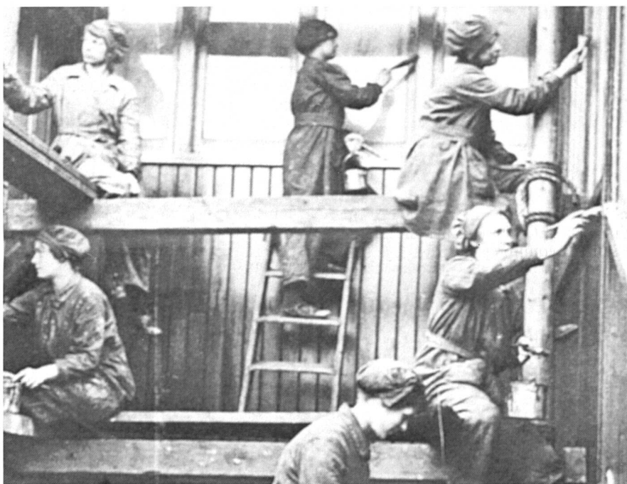
Pendant la Première Guerre mondiale, des centaines d'Anglaises exercèrent des métiers masculins, recevant (temporairement) des salaires d'hommes. Ici, femmes peintres en bâtiment.

Voici, enfin, tout ce que vous avez toujours voulu savoir sur la situation des femmes ménagères et salariées à Genève. Mais attention, tout ce qui brille n'est pas de l'or!