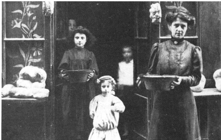
Photo illustrant la couverture du livre «Les femmes, le travail et la famille».

D'abord nourrir la maisonnée, élever les enfants, ensuite ramener de l'argent à la maison : telle a été pendant des siècles, l'histoire du travail des femmes, travail défini comme une activité productrice consacrée à la maisonnée (élever des enfants, nourrir et entretenir une famille) et/ou consacrée au marché du travail. La première activité est bénévole, la seconde salariée. Or il est impossible de comprendre l'histoire des femmes, sans tenir compte de la première, le travail domestique. Ce sont les conclusions auxquelles sont parvenues Louise A. Tilly et Joan W. Scott, économistes et historiennes américaines dans leur livre « Women, work and family » 1 .