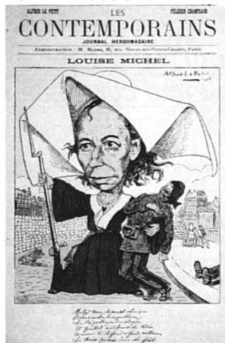
Louise Michel, « la nonne rouge », caricature de 1880.

La Bibliothèque Marguerite Durand, à Paris, édite une série de 7 cartes postales reproduisant des documents anciens appartenant à ses collections. Voilà qui va faire plaisir aux collectionneuses de documents relatifs à l'histoire des femmes. Ces cartes peuvent être commandées à l'Agence culturelle de Paris, 6, rue François-Miron, 75004 Paris. (Prix : FF 2.50 la pièce).