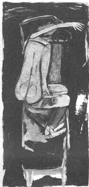
Œuvre de Monika Dillier

« F-Questions au Féminin »* consacre un numéro passionnant (3/86) au thème : femmes et culture, à lire de bout en bout. Il fait parler de leurs problèmes des artistes et des journalistes suisses allemandes et romandes appartenant au monde des lettres, du théâtre et du cinéma, des arts plastiques.