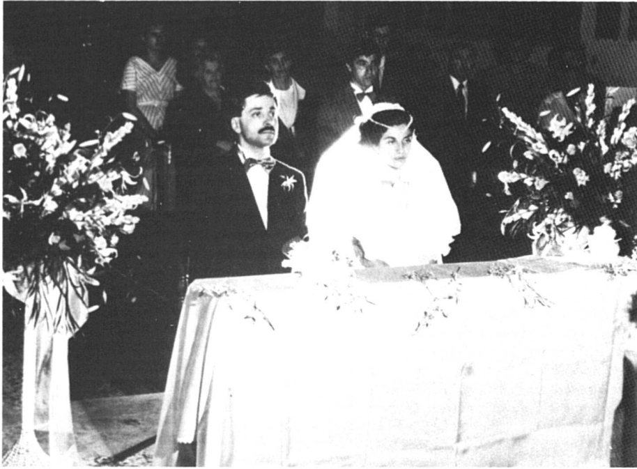
Dans certaines couches sociales, le mariage reste le seul moyen d'échapper à l'emprise des parents

Photo tirée de « Une année des femmes 1985 », par Gaston Malherbe, André Eiselé, Editeur.