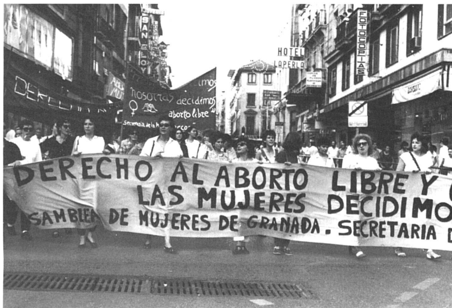
Manifestation pour la libéralisation de l'avortement dans les rues de Grenade.

“Pour la majorité des hommes, y compris de la gauche, nous sommes mères et épouses avant tout”