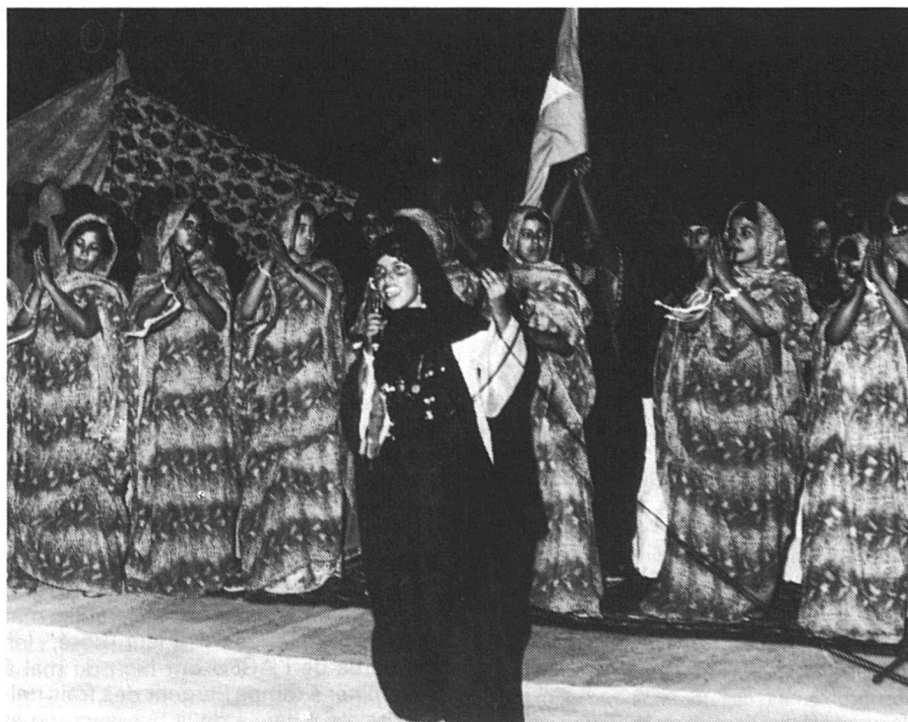
Soirée culturelle pendant le 1er congrès des femmes sahraouies.

Le vent de sable n'en finit pas de faire tournoyer les mellafas colorées des femmes. Secouées avec d'autres compagnes à l'arrière d'une land-rover qui serpente sur des pistes indéchiffrables,