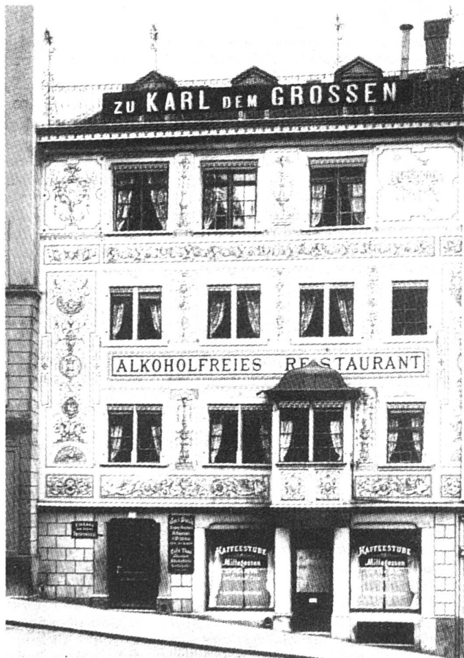
Karl der Große, Kirchgasse 14, le jour de son ouverture en 1898

En outre, il a d'emblée assuré une vraie formation professionnelle à son personnel et lui a proposé des loisirs éducatifs, leçons de gymnastique et de couture par exemple. Dès 1904, il a créé une caisse de retraite. Il a toujours été en avance sur son temps en ce qui concerne les conditions de travail, les congés, les vacan-