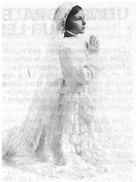
Une communiant des années 30 : promise à un destin de mère au foyer ou de vierge. Et aujourd'hui ?

Cette encyclique a été rédigée malgré les recommandations contraires de la commission d'experts désignée par Paul VI. Elle a d'emblée rencontré une forte op-