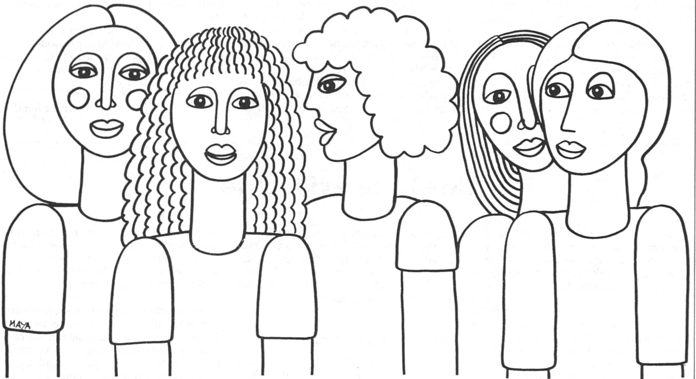
Dessin figurant sur le papillon de présentation du Centre-F à Genève