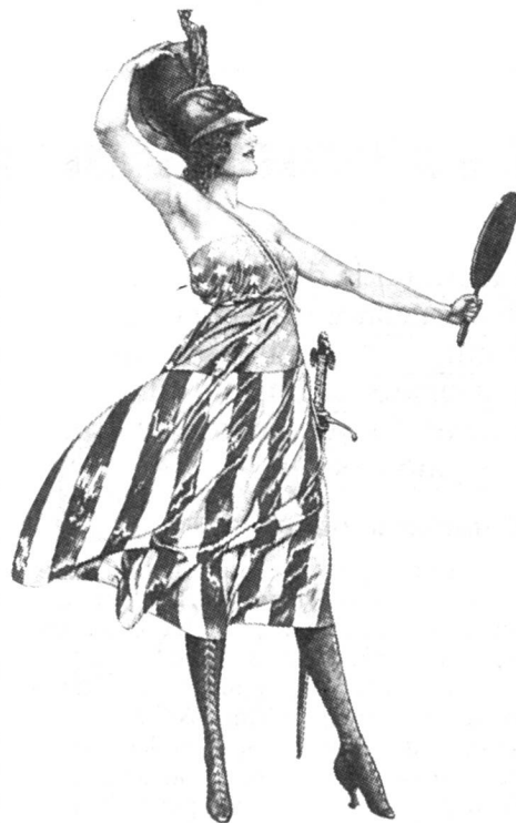
1917, dessin d'Herrouard

Pour chaque solution, on indique les avantages qu'en retirerait la défense générale, ainsi que les mesures d'organisation et les mesures juridiques nécessaires. Pour les options 7 et 8, une modification de la Constitution serait nécessaire. ● (pbs)