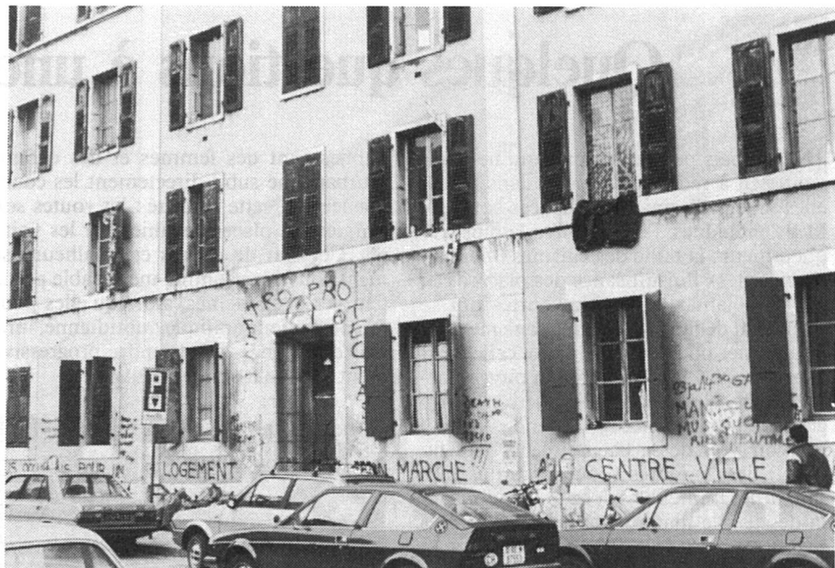
Immeuble «occupé» à Genève. Sur la façade: «Nous occupons pour un logement bon marché au centre-ville»

Puisque l'on peut aujourd'hui prévoir avec suffisamment d'exactitude la demande de logement en 1985, voire en 1990, l'on sait, toujours dans le cas de Genève, qu'il faudra, selon toute vraisemblance, 11 000 logements de plus d'ici deux ans. Mais si les autorités cantonales savent bien qui voudra quoi (en nombre de pièces), en 1990, elles ne savent ni où (banlieue ou centre ville), ni comment (grands ensembles ou petits immeubles locatifs, voire villas), bref, elles ne connaissent rien des atti-