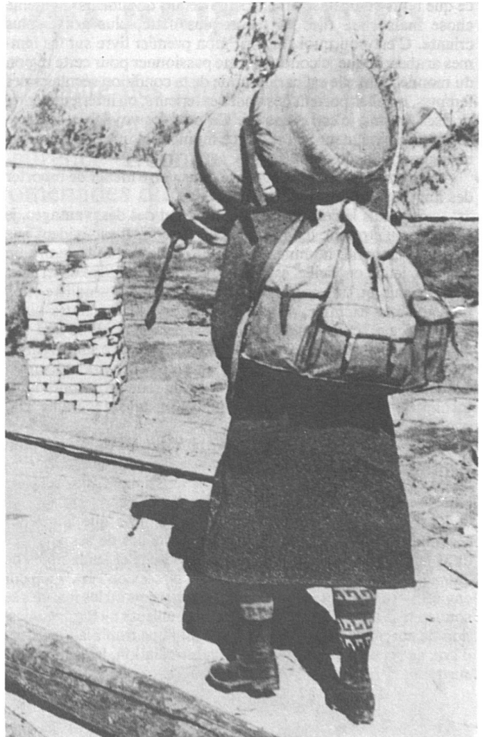
Ella Maillart dans ses pérégrinations à travers le Turkestan russe, 1932.

Le Père Teilhard de Chardin, que j'ai eu la joie de rencontrer souvent, lors de mon séjour à Pékin, m'avait bien dit que je cherchais Dieu... mais ce n'était alors qu'un mot pour moi.