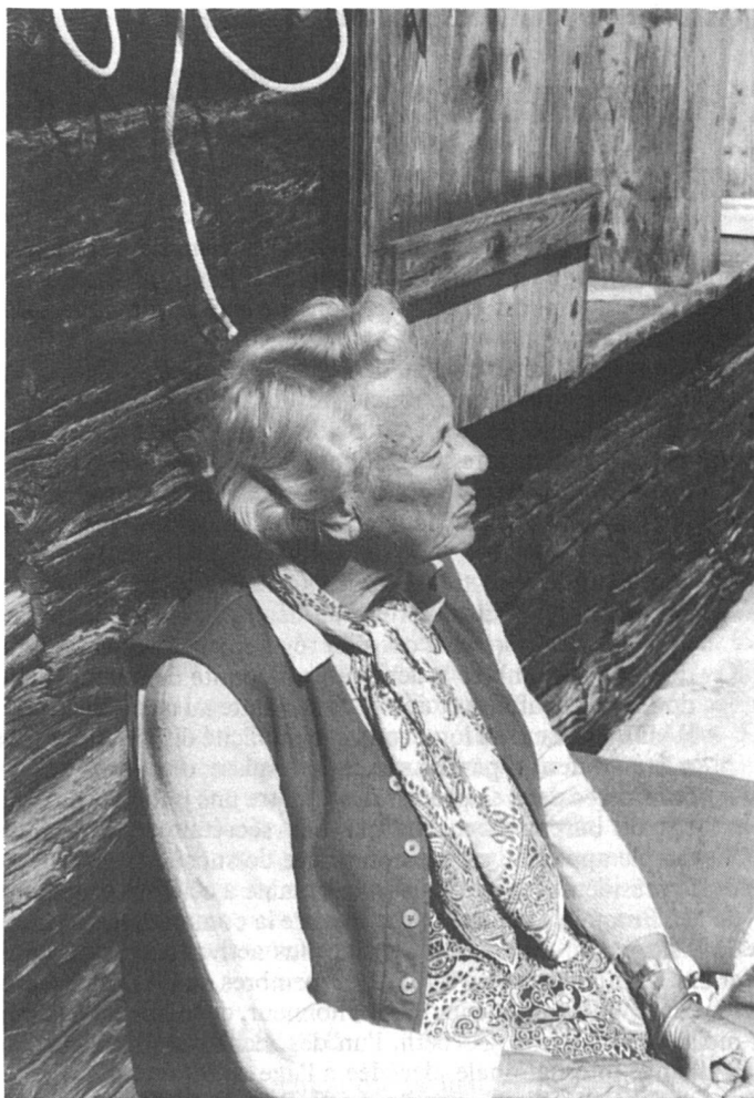
Ella Maillart aujourd'hui, devant son chalet de Chandolin (Valais) où elle passe six mois par année. ▲

Trois Tangoutes et un Chinois voient une photo de chameaux — au nord du Tibet. ▼