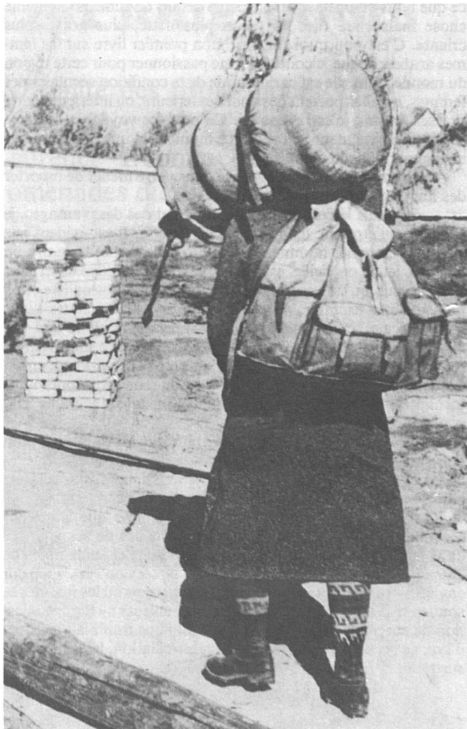
Ella Maillart dans ses pérégrinations à travers le Turkestan russe, 1932.

Le Père Teilhard de Chardin, que j'ai eu la joie de rencontrer souvent, lors de mon séjour à Pékin, m'avait bien dit que je cherchais Dieu... mais ce n'était alors qu'un mot pour moi.