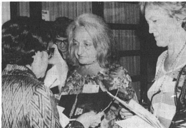
Betty Friedan (au centre)

Les « femmes libres ukrainiennes » faisaient une triste grève de la faim sous une banderole qui n'intéressait guère, mais le