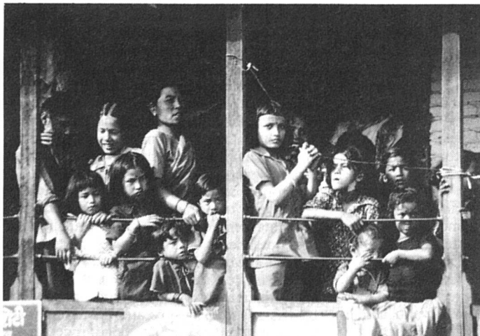
Pour elles, des lois nécessaires...