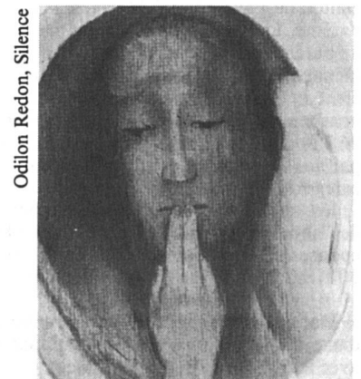
Odilon Redon, Silence