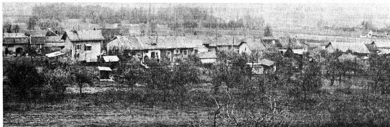
Dire « Zut » au village !

Une commune, et une commune rurale (genevoise en l'occurrence) plus qu'une autre peut-être, c'est une sorte de grande famille.