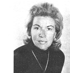
Comité du Lycéum Club, présidente de la section sociale, membre de l'Association tessinoise de parents d'élèves pour la scolarité spécialisée et de diverses institutions culturelles. Membre du Comité depuis 1972.

Après quelques années d'activité professionnelle, elle se maria avec un pharmacien et se consacra, à côté de l'éducation de ses trois enfants, à l'étude d'œuvres sociales et culturelles. Elle est même membre du