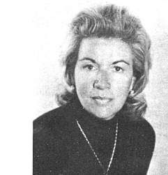
Comité du Lycéum Club, présidente de la section sociale, membre de l'Association tessinoise de parents d'élèves pour la scolarité spécialisée et de diverses institutions culturelles. Membre du Comité depuis 1972.

Après quelques années d'activité professionnelle, elle se maria avec un pharmacien et se consacra, à côté de l'éducation de ses trois enfants, à l'étude d'œuvres sociales et culturelles. Elle est même membre du