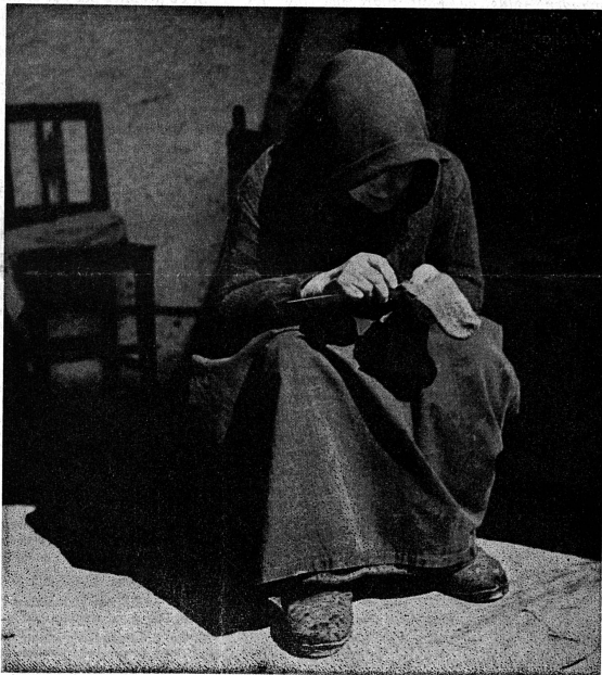
Cette vieille Tessinoise profite du moindre rayon de soleil pour travailler devant sa maison.