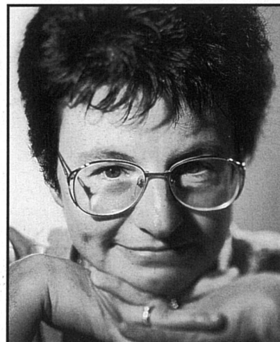
Silvia Ricci Lempen est écrivaine et journaliste. Avant est son troisième roman.

ni complaisance, au style volontairement neutre et précis, en particulier sur les détails de la maladie et des corps torturés, quelques fenêtres s'ouvrent cependant sur la douceur d'un moment ou la beauté d'une journée: «C'est une journée d'été très pure et cristalline, et avec les yeux fermés on pourrait se croire dans la montagne, odeur d'écorce et d'aiguilles de pin, de roches chaudes, d'eau ruisselant dans l'herbe au pied des troncs excavés en abreuvoirs» (p.168).