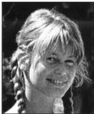
La top model Claudia Schiffer avec ses mensurations peu communes fait rêver les fous de notre époque.