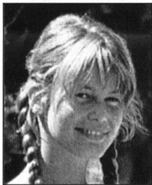
La top model Claudia Schiffer avec ses mensurations peu communes fait rêver les foules de notre époque.