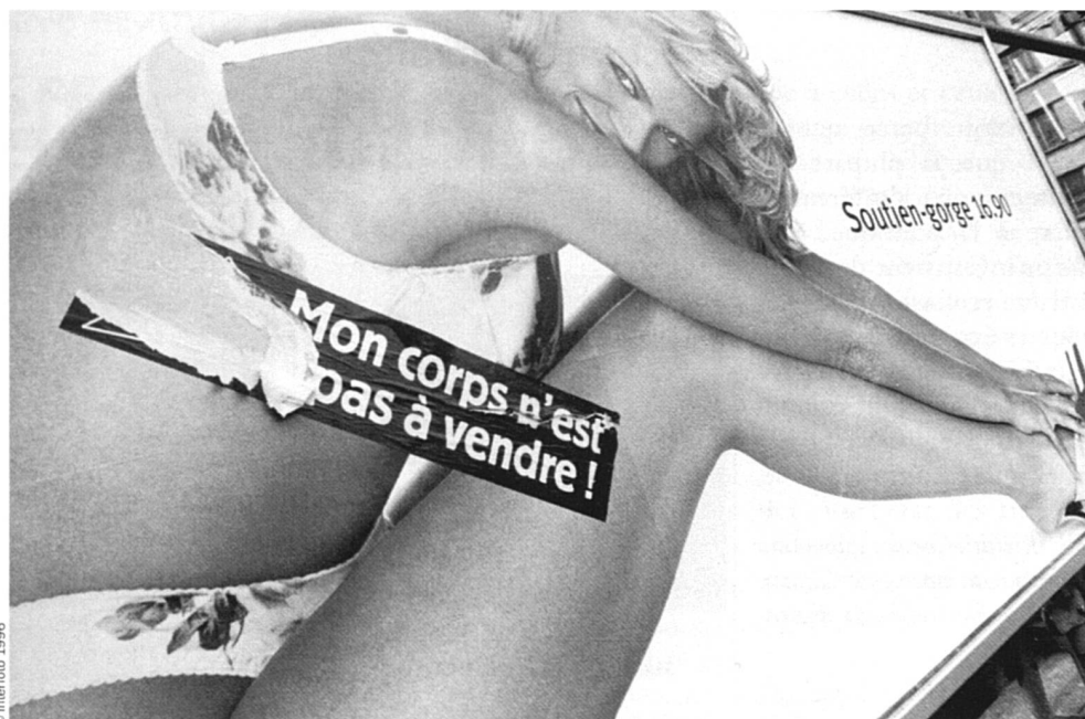
Certaines femmes font de la résistance.

Il y a quelque temps, un chœur d'hommes qui a toujours fermement refusé la mixité préparait un concert. Une villageoise pianiste l'accompagnait bénévolement pendant les répétitions et le concert. Pour fêter le succès qu'il remporta, le chœur décida de s'offrir une «virée» et invita... le mari de la pianiste. Celui-ci a accepté, sans états d'âme, rassurez-vous!