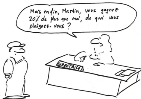
Tiré de «Aujourd'hui des chrétiens», fév. 1999, auteur inconnu

frappants, on apprend par exemple que les mêmes événements, ou les mêmes caractéristiques de la vie professionnelle ou privée ne se répercutent pas de la même manière chez les travailleuses et les travailleurs. Le mariage augmente le salaire des hommes autant qu'il diminue celui des femmes; les années de formation et d'expérience valent aux hommes des primes supérieures à celles qu'en reti-