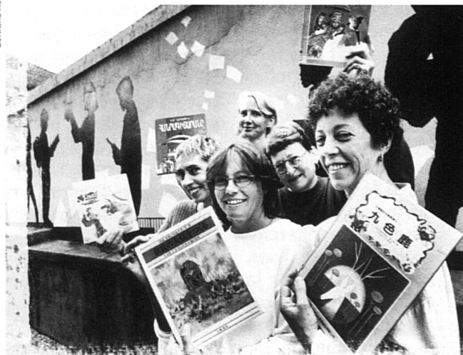
Globlivres met à la disposition de la communauté 15 000 livres représentant plus de 180 langues, tous genres confondus. Après dix ans d'existence, la démarche novatrice de Globlivres reste intacte.