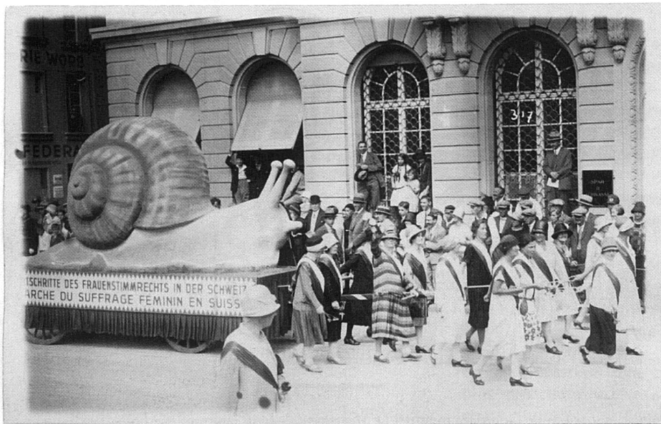
Années 1920. Les suffragistes protestent contre le rythme d'escargot auquel se traîne le suffrage féminin.