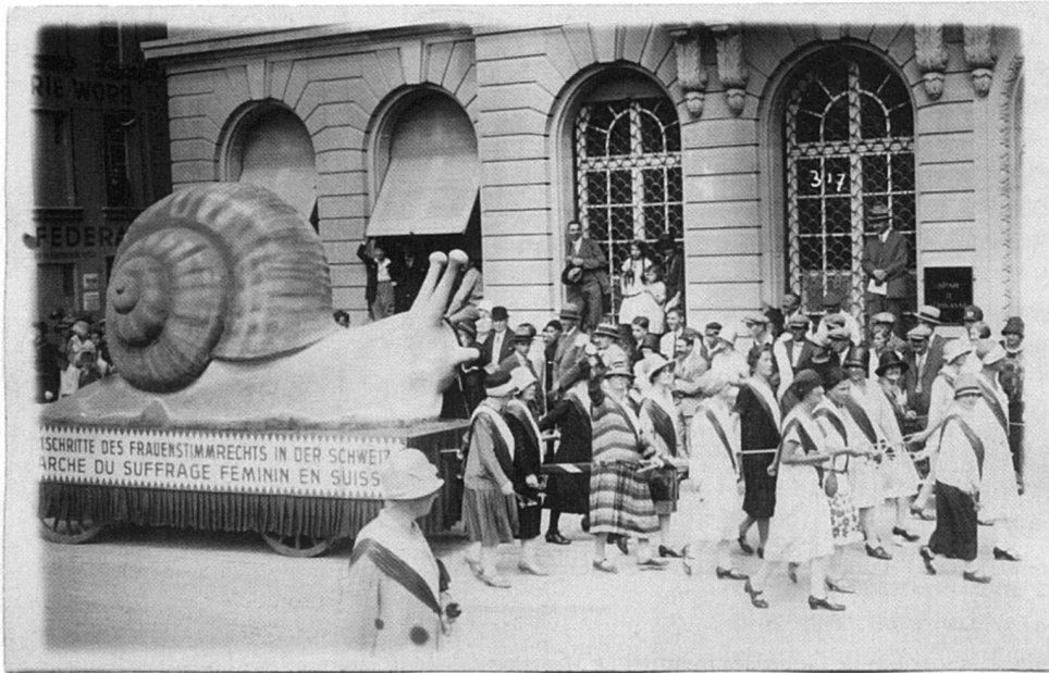
Années 1920. Les suffragistes protestent contre le rythme d'escargot auquel se traîne le suffrage féminin.