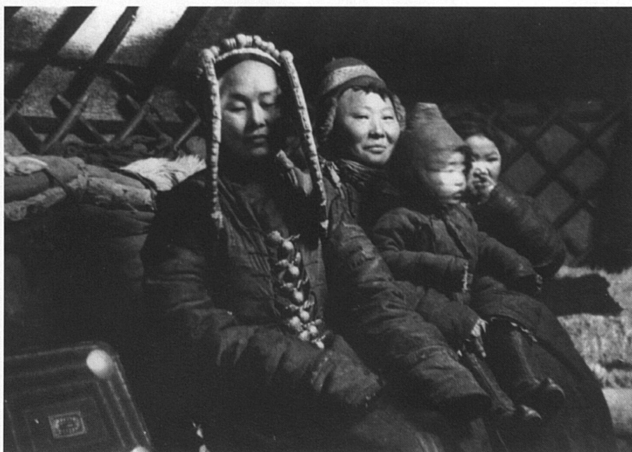
Princesse khalka, Barga, Mandchoukouo japonais (aujourd'hui Mandchourie, Chine), 1934