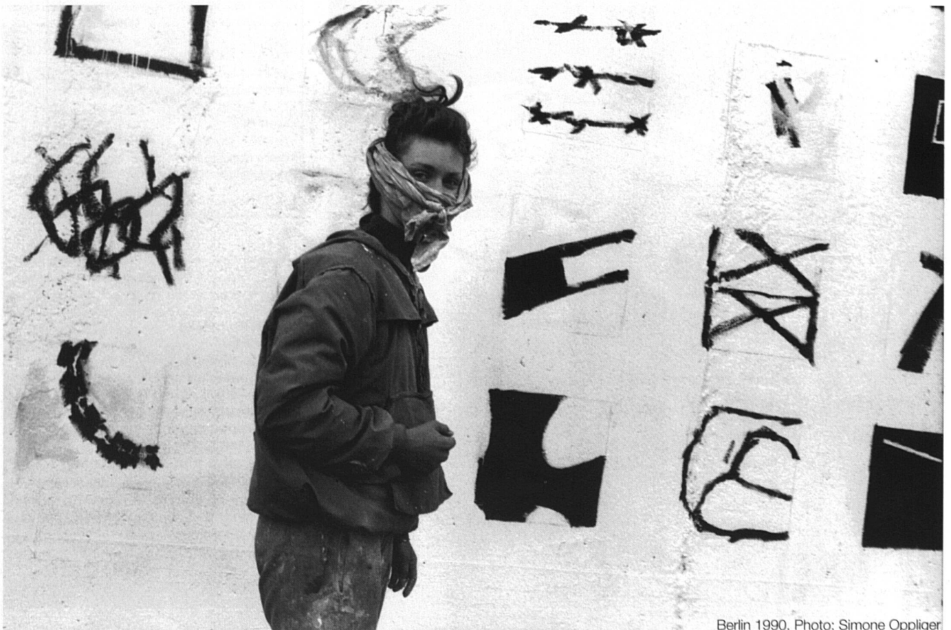
Berlin 1990.

«C'est à Berlin, quelques semaines après la chute du Mur. Une jeune femme peint. (Elle porte un bandeau à cause de la peinture). Une femme créatrice, c'est forcément une féministe. Créer, c'est avoir son point de vue sur les choses, c'est s'affirmer. Créer, c'est la plus belle façon d'être féministe.»