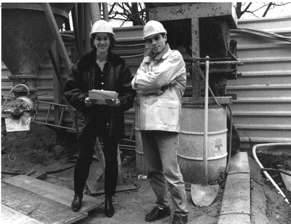
«Ingénieurs, ingénieures»

Fait marquant: c'est dans le cadre des animations de groupes que les