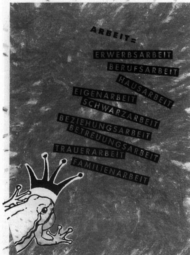
BÜRO FÜR GLEICHSTELLUNG VON FRAU UND MANN, ZUG, TÉL. 042 25 39 19/20

L'avant-projet propose une assurance perte de gain à l'intention des mères exerçant une activité lucrative dépendante ou indépendante. La perte de gain, limitée à un revenu annuel maximal de 97 200 francs, serait compensée intégralement pendant le congé de maternité, fixé à seize semaines. Le financement serait assuré par un supplément de 0,4% sur les cotisations AVS. Cet avant-projet annonçait également, dans une étape suivante, le versement de prestations destinées aux femmes dans le besoin qui n'exercent pas d'activité lucrative, ainsi que l'institution d'un congé parental.