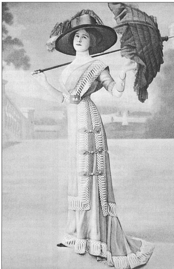
Présentation de mode anglaise en 1913.

Les femmes parfaites seraient-elles les seules à pouvoir choisir leur look? C'est l'hypothèse contraire