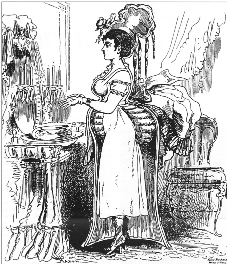
Etre et paraître. Coupe, plan et élévation d'une femme à la mode en 1869.

Intéressante impasse. Est-ce la nouveauté du mot qui gêne (l'anglicanisme? le néologisme?), ou faut-il repérer là au contraire une vieille réticence bien connue à l'égard de l'apparence, plus exactement de son apparence? Mon look, connais pas. Le diktat de la mode, pas pour moi. Les raisons abondent, et sont toutes excellentes.