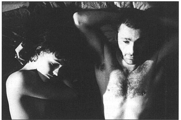
Des pans entiers du droit de la personne humaine échappent à l'application du droit parce qu'ils concernent la sphère privée.

Un discours que reprend au vol l'économiste Mascha Madörin, membre de l'action Place financière suisse et tiers monde et du Conseil des femmes pour la politique internationale. Sous l'influence conjuguée du néolibéralisme économique et de la politique de la Banque mondiale dans les pays en développement, la situation des femmes et des enfants ne cesse de se dégrader, souligne-t-elle, parce que ces pays, contraints de réaliser des économies, préfèrent couper dans les budgets de la santé et de l'éducation. La politique économique est exclusivement orientée sur les besoins des hommes. Les femmes sont exclues, y compris dans les pays industrialisés, des sphères décisionnelles du pouvoir économique. Pire encore, ajoute-t-elle, le travail qu'elles accomplissent dans le domaine so-