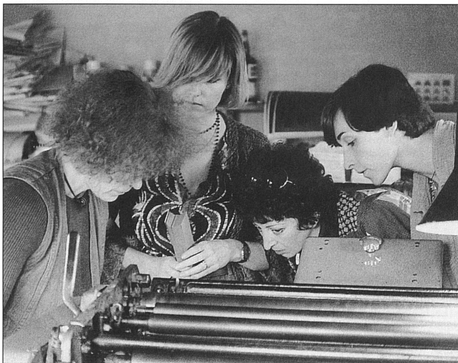
Le crédo de PACTE: faire une place aux femmes dans les entreprises.

Rosy est dessinatrice de machines. Pour garder un pied dans le métier et concilier son activité professionnelle avec l'éducation de ses deux enfants, elle exécute à domicile des mandats ponctuels pour une grande entreprise vaudoise. Sur la table à dessin qui occupe toute une pièce de son appartement, les commandes se raréfient. Des programmes informatiques performants remplacent désormais avantageusement les dessinatrices occasionnelles. Impossible de suivre l'évolution technologique lorsqu'on travaille chez soi à temps partiel. Pour des questions de coûts d'abord qui ne permettent pas d'envisager l'investissement d'un matériel informatique performant, à remettre régulièrement au goût du jour. Les cours de perfectionnement ricanant du porte-monnaie, et le temps