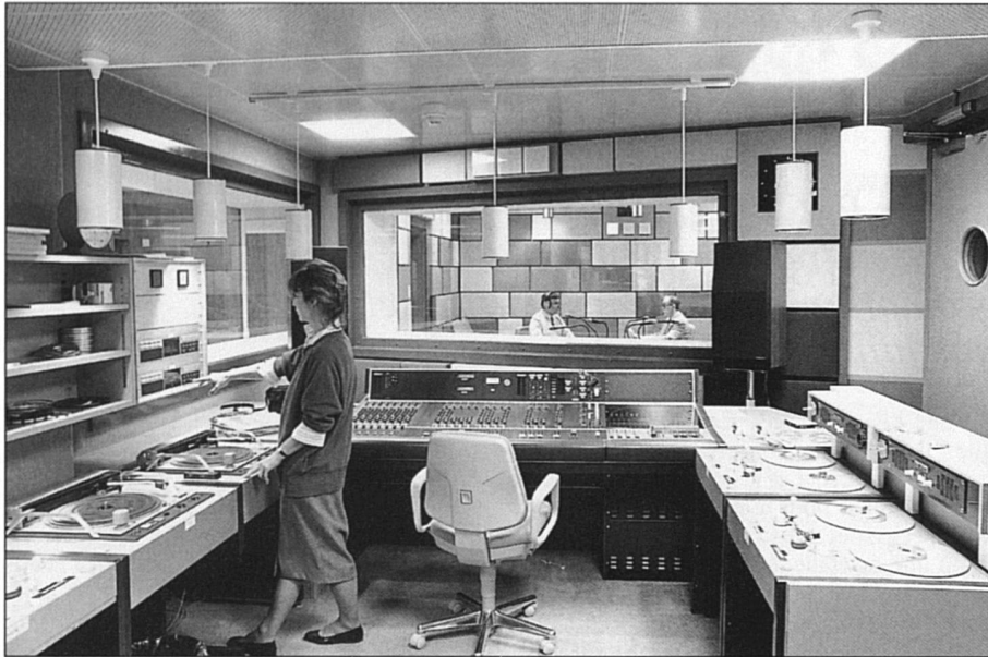
La RTSR n'est pas en reste.