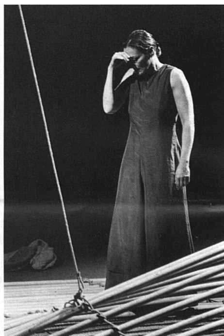
Diotime: regard sur l'être-femme.