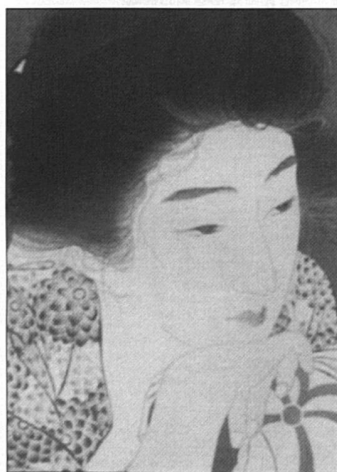
Torii Kotondo, La Coiffure du Matin (1932).

Vendredi 29 avril , à 17 h: causerie de Wendula Lasserre sur les minéraux et gemmes, avec dias.