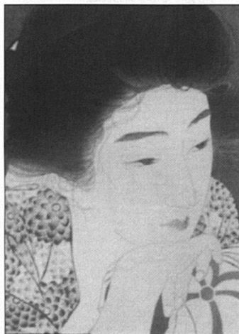
Torii Kotondo, La Coiffure du Matin (1932).